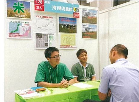
就農イベントで社員を募集。現在、社員の平均年齢は32歳という若さだ。上越出身者は社長を含めて2人だけで、東京、大阪、長野、山形など、ほとんどが県外出身者。入社時点では全員が農業未経験者だという

地域の土地を活かし、市場のニーズにしっかり応え、なおかつ働く人の人生を豊かにしていく。そんな同社の経営方針は、これからの日本の農業に必要な、新たなスタイルを提案してくれている。